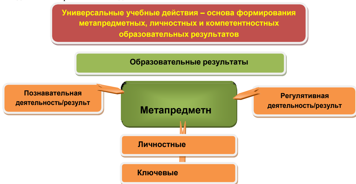
Рис. 3. Система оценки образовательных результатов

Интерпретация результатов оценки ведётся на основе контекстной информации об условиях и особенностях деятельности субъектов образовательного процесса. В частности, итоговая оценка обучающихся определяется с учётом их стартового уровня и динамики образовательных достижений.